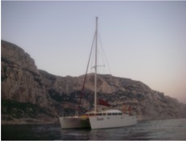
Coucher de soleil dans les calanques