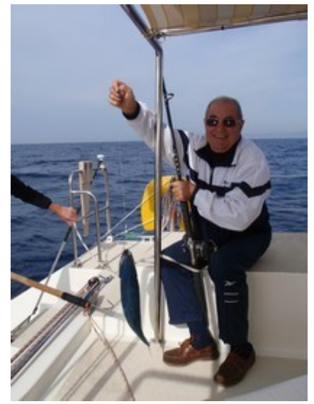
Le trésorier au travail!

Notre premier adhérent: Apparemment HEUREUX!